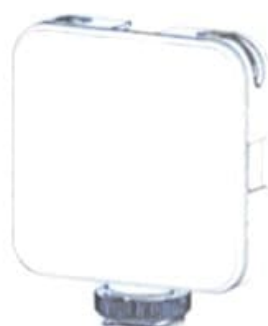
W64 RGB 1